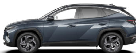
Dark Teal Metallic nicht für N Line