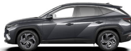
Dark Knight Gray Pearl