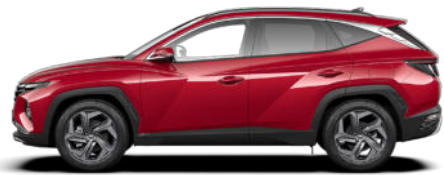
Sunset Red Pearl