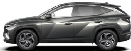
Amazon Gray Metallic nicht für N Line