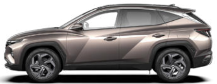
Silky Bronze Metallic nicht für N Line