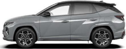
Shadow Gray nur für N Line